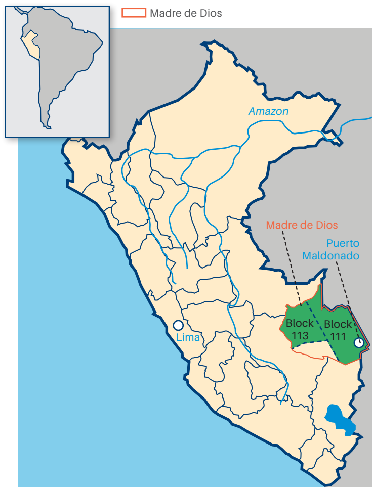
Mapa de la ubicación del Bloque 113 en el Sureste de Perú, en la frontera con Brasil.

SAPET, la filial peruana de CNPC, ha sido una de las primeras empresas petroleras chinas activas en el extranjero y opera en Perú desde la década de los noventa. En 2005 SAPET adquirió derechos de exploración para el bloque 113, que se superponía con una reserva territorial para pueblos indígenas en aislamiento voluntario, grupos que son extremadamente vulnerables al contacto con personas externas debido a la falta de inmunidad a enfermedades comunes en el resto del mundo. Estos grupos gozan de protección especial bajo la ley peruana y las operaciones petroleras previas en el área se habían detenido debido a su presencia. Después de conocer la situación de las federaciones indígenas y grupos de la sociedad civil, SAPET realizó varias reuniones con líderes indígenas y representantes de ONGs y decidió no explorar en esta parte de su concesión, sin tener en cuenta la oposición inicial del gobierno peruano y defendiendo los derechos de la población local vulnerable. Este es un precedente muy significativo de apegarse a un alto estándar de responsabilidad social, incluso sin el apoyo de los gobiernos anfitriones.