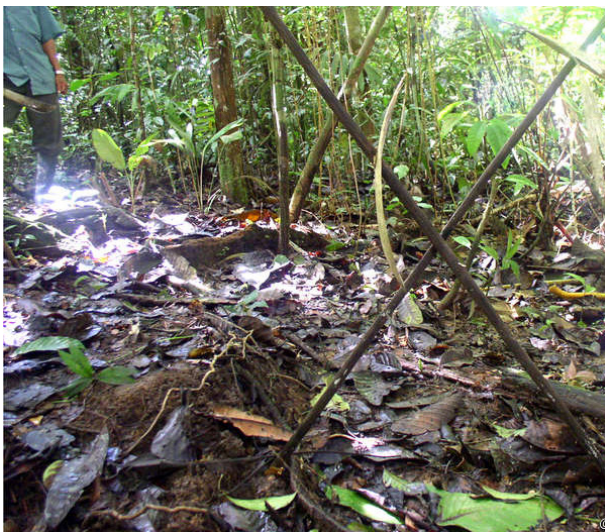
Una señal dejada por no contactados, indicando: prohibido entrar.

mediante el sacrificio de movimientos sociales en luchas largas y difíciles. Respetar estos logros y contribuir activamente a su implementación, incluso si eso significa desistir de un proyecto polémico, es importante. En el presente caso, FENAMAD ya había señalado que la concesión del Bloque 113 estaba en conflicto con la Convención ILO 169, la Resolución Ministerial No. 0427-2002-AG, y el Decreto Supremo No 024-2005-PCM (Servindi 2006b).