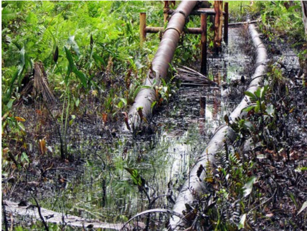
Derrame de petróleo en la Amazonía peruana en 2016.