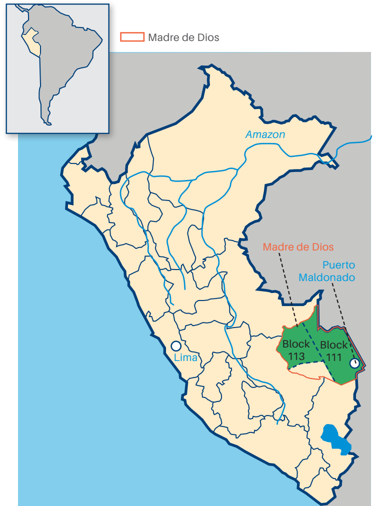
插图1：位于秘鲁东南部、与巴西接壤的第113号勘探区位置图。

中国石油在秘鲁的子公司中美石油开发秘鲁分公司（“SAPET”）是中国在海外设立的第一批石油企业，自上世纪90年代以来一直在秘鲁开展业务。SAPET于2005年取得第113号勘探区的勘探权，该勘探区涉及一处当地自愿群居的原住民保护区，这些原住民部落因为对世界其他地区普遍存在的疾病没有免疫力，非常容易被外来人群所携带的疾病感染。这些部落受秘鲁法律的特殊保护，且由于这些部落的存在，该地区之前的石油勘探活动都已经停止。通过民间社会团体了解到这一情况后，SAPET与非政府组织代表举行了会谈，为保护当地弱势群体的权利，决定停止在该特许勘探区内进行勘探工作，虽然此前秘鲁政府反对停止勘探。这是在东道国政府没有提出相关要求的情况下坚持高标准履行社会责任的一个典型案例。